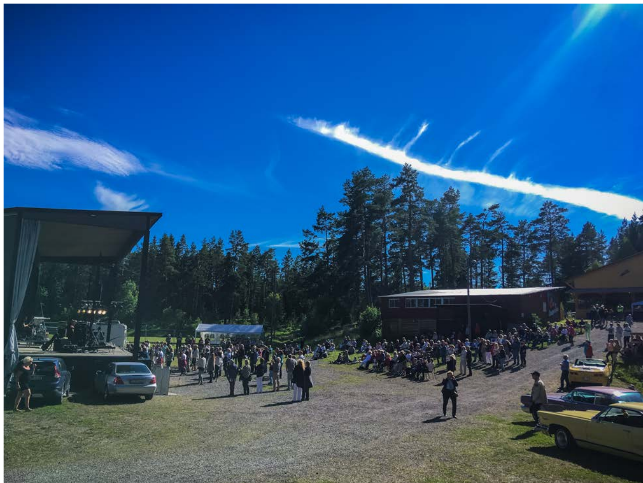
Hep Stars uppträder på Skogsvallen.