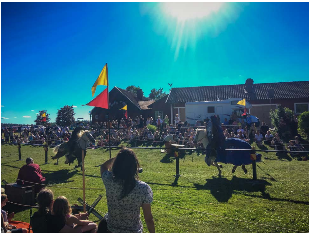
Tornerspel vid Vittinge kyrka.