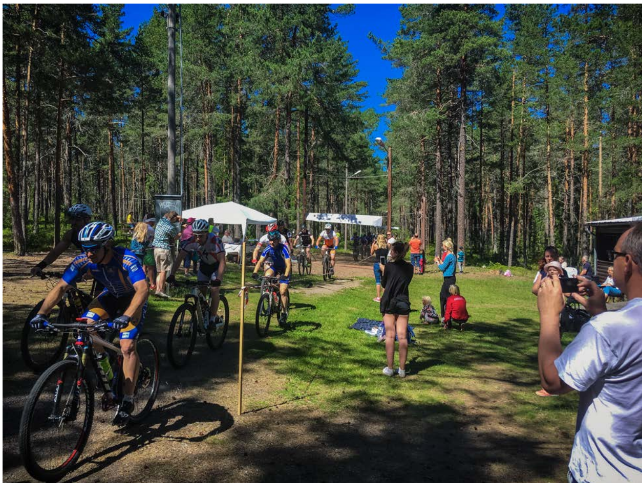
Ett mountainbikelopp startar under Hebyhälsan.